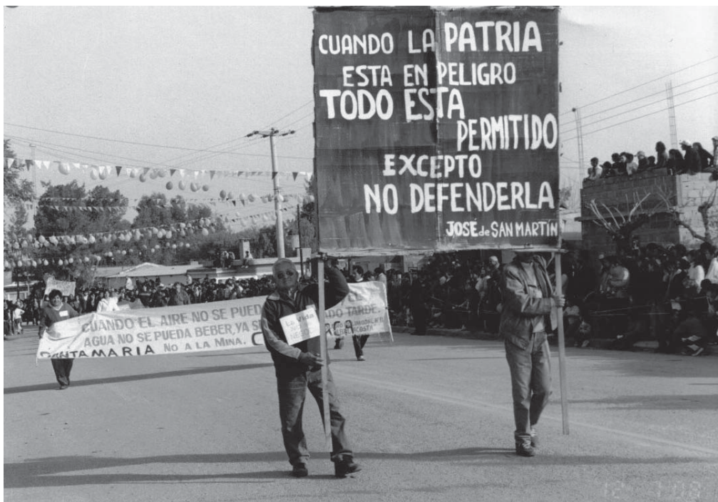
Protesta contra la minería en Catamarca