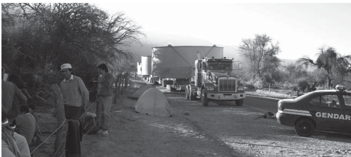
Bloqueo a convoy con material para la Mina Alumbreira en Quilmes, provincia de Tucumán

E.10. Las empresas transnacionales y otras empresas comerciales observarán y respetarán las normas aplicables del derecho internacional, las leyes y los reglamentos nacionales, así como las prácticas administrativas, el estado de derecho, el interés público, los objetivos de desarrollo, las políticas sociales, económicas y culturales, incluidas la transparencia, la responsabilidad y la prohibición de la corrupción, y la autoridad de los países en los que realizan sus actividades.